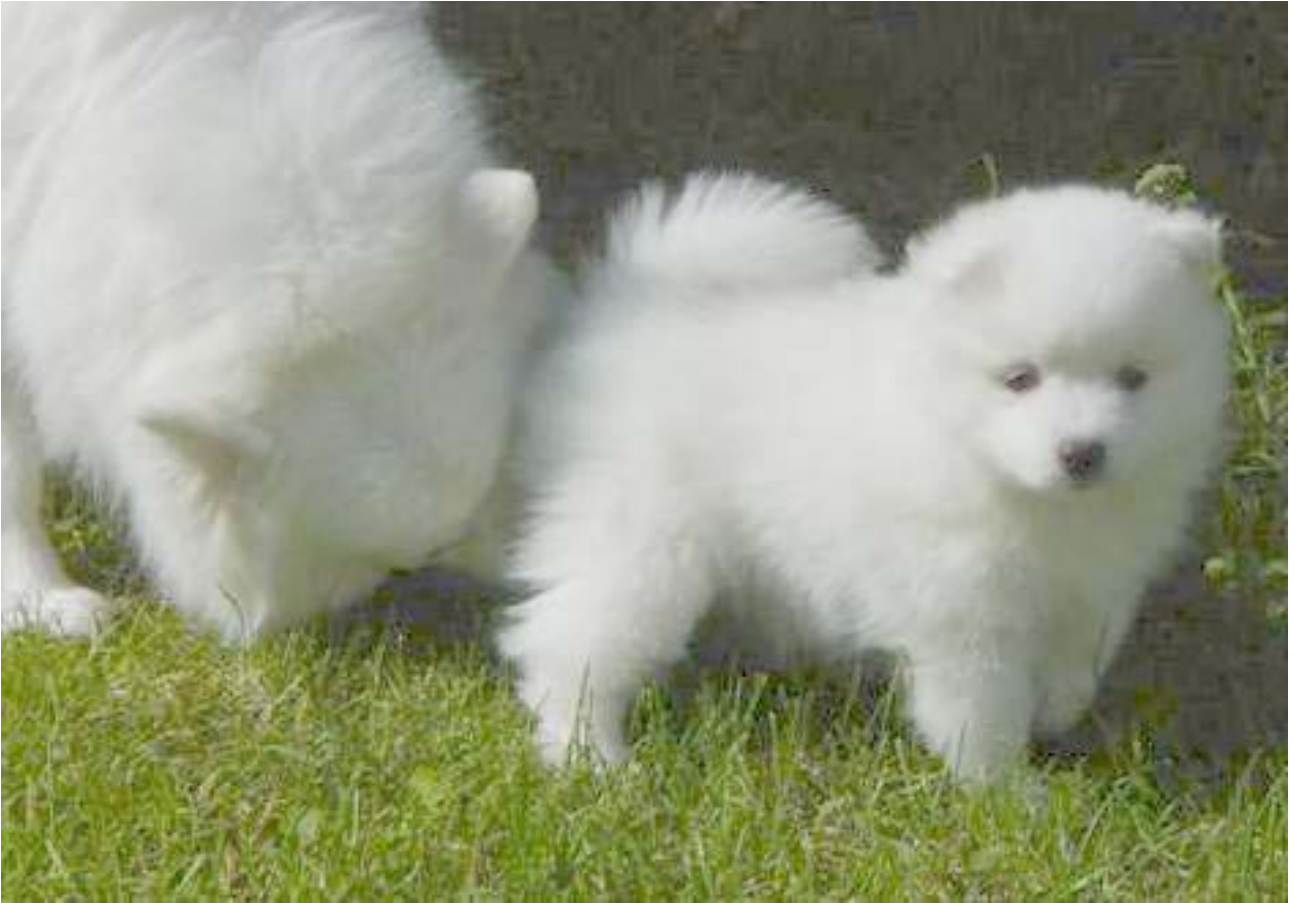
Fem veckor - helt underbar! Som jag längtade att få hämta hem honom!