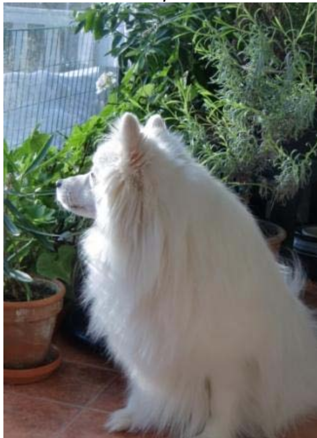
Filip x 2